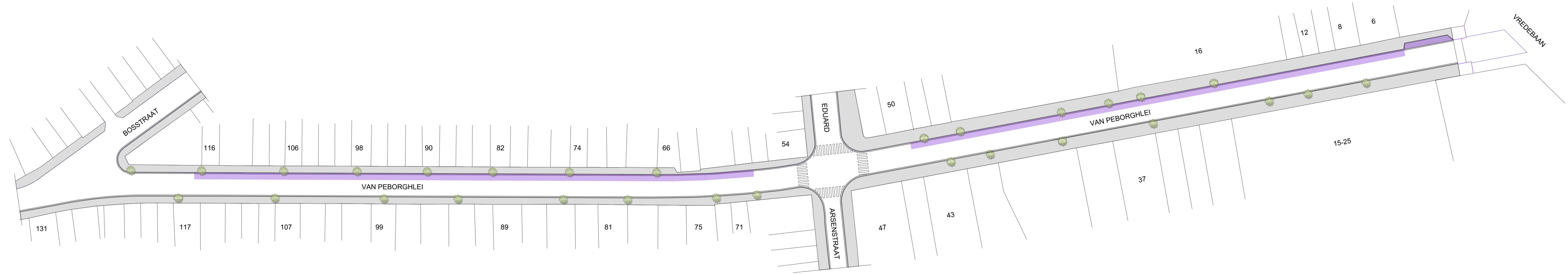
BESTAANDE TOESTAND 1/500